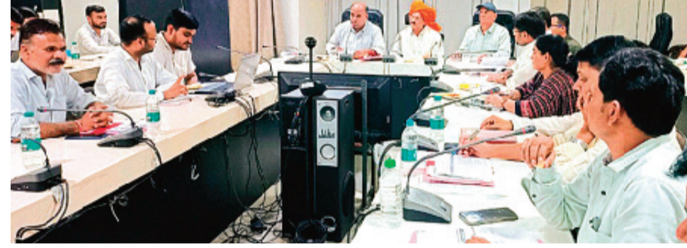
हरिभूमि न्यूज ▶▶ राजगढ़

मुख्यमंत्री हेल्प लाईन के शिकायतों के निराकरण में कई तरह की लापरवाहियों के मामले सामने आ रहे हैं। कुछ विभागों में इन शिकायतों को बंद करने शिकायतकर्ताओं पर दबाव बनाया जा रहा है बल्कि कुछ शिकायतें बगैर निराकृत किए ही बंद की जा रही हैं। इसके साथ ही अनेकों शिकायतें महीनों से लंबित होने के बाद भी विभाग प्रमुखों