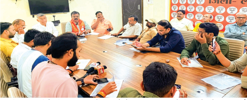
सम्बन्धी उपकरण, उर्वरकों, कीटनाशक, राहत देकर किसानों को लाभान्वित किया है और किसानों की आमदनी दुगुनी करने की दिशा में आगे कदम बढ़ाया है इसी तरह किसानों और ग्रामीण समाज

भारतीय जनता पार्टी की ललितपुर इकाई ने आज प्रेस वार्ता कर केन्द्र सरकार द्वारा जैन जी एस टी रिफॉर्म चार स्लैब से दो स्लैब कर सरलीकरण करने और बहुत सी आवश्यक वस्तुओं पर टैक्स कम करने को लेकर जानकारी दी।