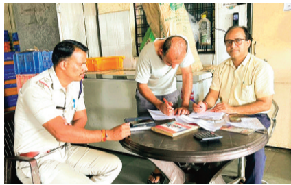
हरिभूमि न्यूज ▶▶ राजगढ़

जिले के विभिन्न स्थानों से मिलावटी सामानों की बिक्री के मामले कई बार सामने आ चुके हैं। अधिकतर मामलों में दूध जनित पदार्थों में मिलावट कर उन्हें मार्केट में खपाया जाता है। यह दूध भी विभिन्न तरह के कैमिकल सहित अन्य पदार्थों को मिलाकर बनाने की शिकायतें अक्सर सामने आ रही हैं। इसी के चलते कलेक्टर डॉ. गिरीश